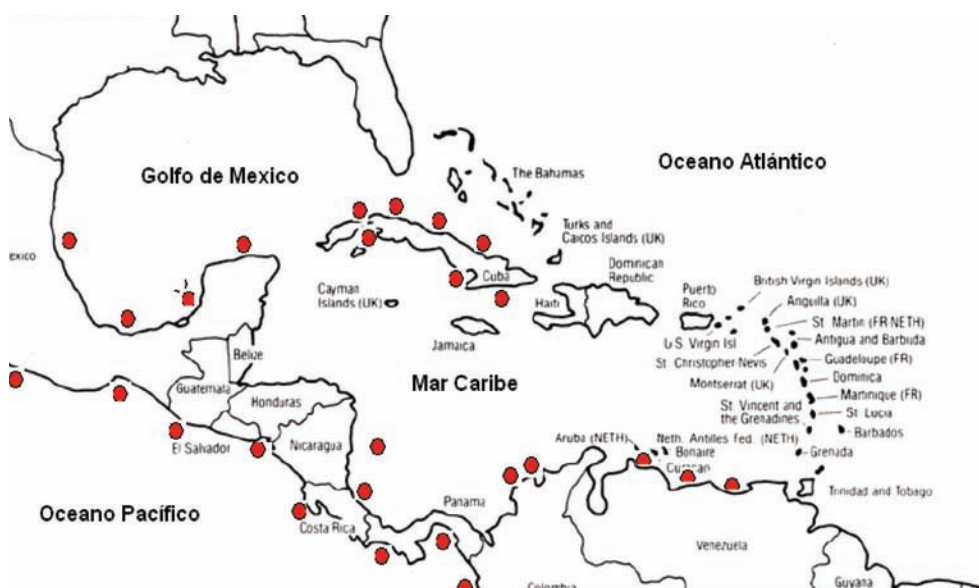
Figura 1. Localización aproximada de los lugares donde han sido registrados FAN y/o intoxicación por microalgas en el Caribe y regiones adyacentes.

Eventos FAN se han registrado y documentado en muchos de los países que hacen parte de la región Caribe causando problemas a diferente nivel (Fig. 1). Algunos de los principales eventos registrados hasta 2007 tanto en la región Caribe como en la Pacífica de estos países, se relacionan a continuación junto con las especies de microalgas identificadas (Tabla 2).